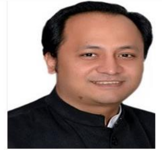
মহিবুল হাসান চৌধুরী, এম.পি. মন্ত্রিত