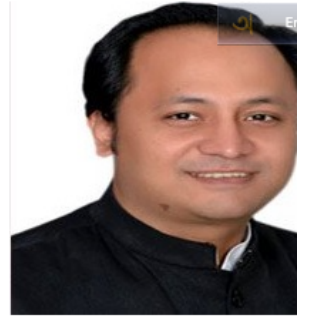
মহিবুল হাসান চৌধুরী, এম.পি.