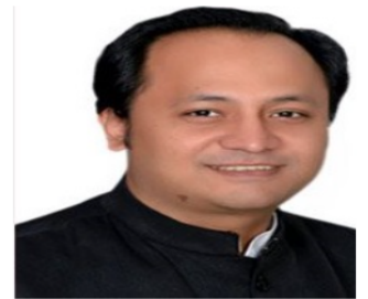
মহিবুল হাসান চৌধুরী, এম.পি.