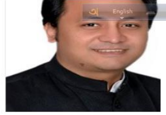
মহিবুল হাসান চৌধুরী, এম.পি. বিত্তান্ত