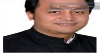
মহিবুল হাসান চৌধুরী, এম.পি.