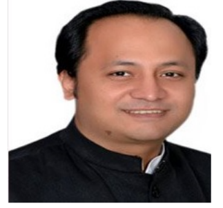
মহিবুল হাসান চৌধুরী, এম.পি. মন্ত্রিত