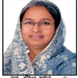
ডা. দীপু মনি এম.পি.