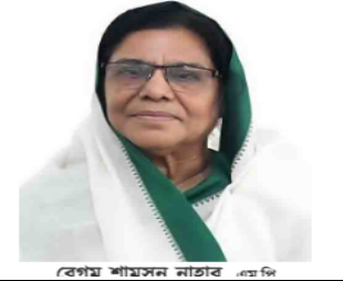
বেগম শাম্মাসুন নাফার, এম.পি.