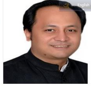
মহিবুল হাসান চৌধুরী, এম.পি.