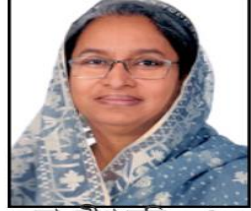
ডা. দীপু মনি এম.পি.